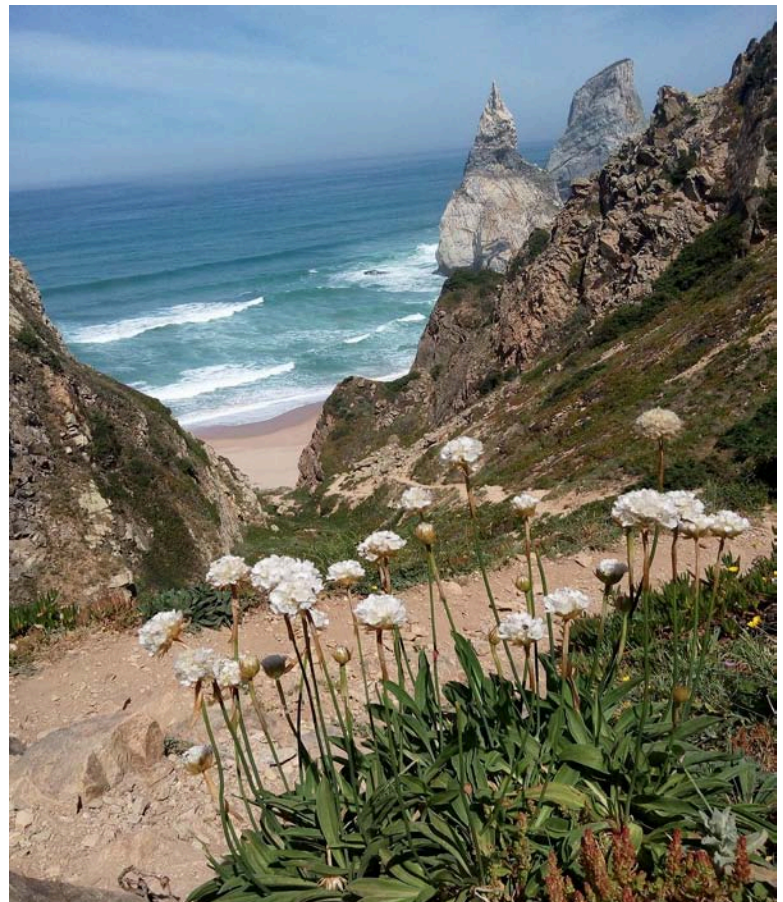
Cabo da Roca - Praia da Ursa, Armeria pseudoarmeria

Local: Praias da Cresmina, Guincho e Abano