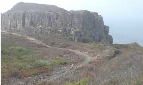
Lomba dos Planos