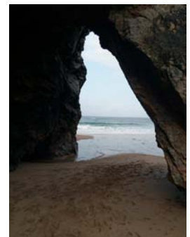
Praia da Adraga